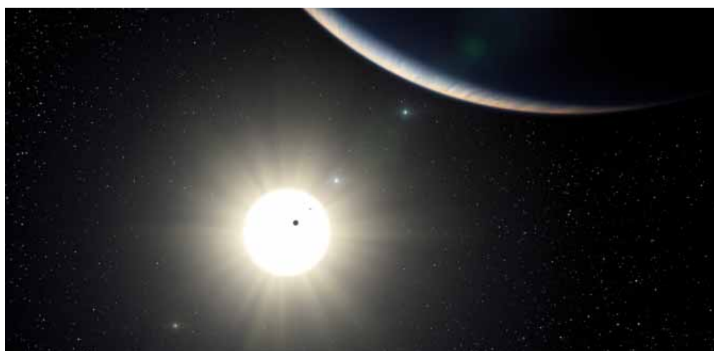
Am 24.8.2010 haben Astronomen der Universität Genf die Resultate ihrer sechsjährigen Messungen mit einem Teleskop der Europäischen Organisation für Astronomie ESO vorgestellt: Sie haben ein Sonnensystem entdeckt, in dem wahrscheinlich sieben Planeten kreisen; 127 Lichtjahre von der Erde entfernt im Sternbild Kleine Wasserschlange gelegen, erinnert das System an unserer eigenes Sonnensystem mit seinen acht Planeten.